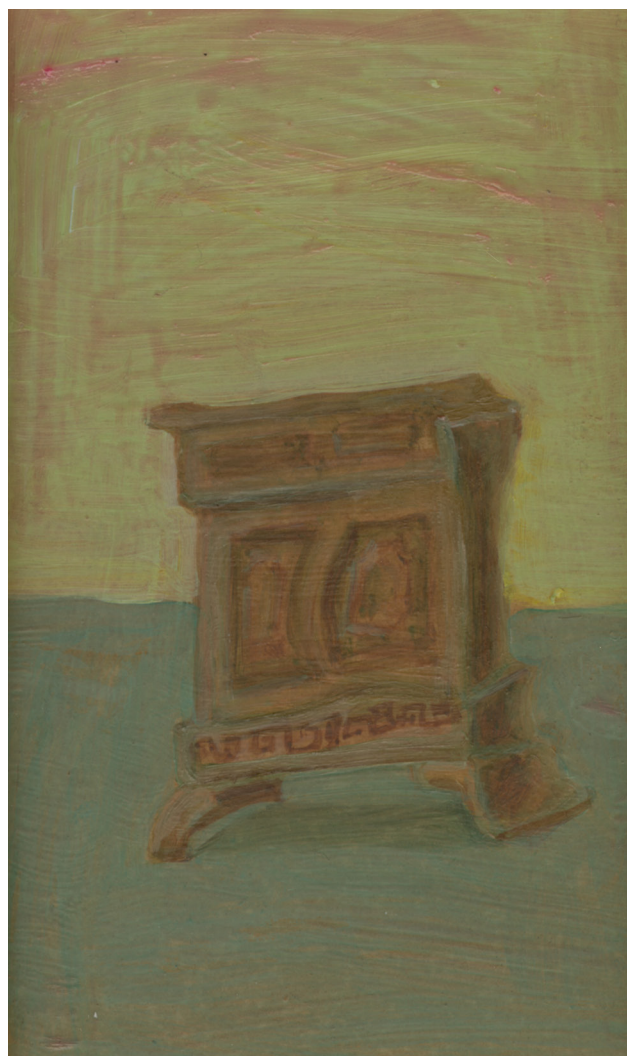
"Byrå" av Carina Ellberg, 1988.

När vi skapar verk av människor kallas de ibland porträtt, men alla verk av människor är inte porträtt. Ett porträtt kan antingen avbilda eller på annat vis representera eller påminna om den eller de som porträtteras. Porträttet kan likna en person så som den ser ut eller ta fasta på något annat än just utseendet. Det kan vara personlighet, vad personen jobbar med eller vilken status personen har. Den som skapar ett porträtt kan välja att förstärka vissa saker och dämpa andra. Ett porträtt visar inte bara något av den som blir porträtterad utan även något av den som skapat porträttet.